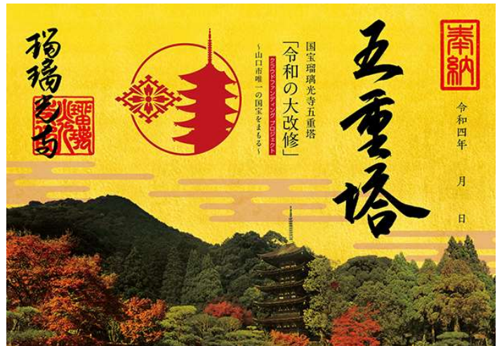
▲瑠璃光寺五重塔の限定御朱印