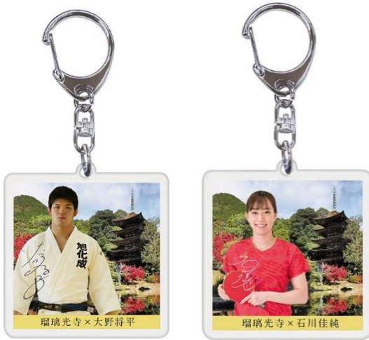
▲限定キーホルダー

瑠璃光寺五重塔クラウドファンディング実施にあたり、山口市出身で柔道のオリンピック金メダリストである大野将平選手と同じく山口市出身で卓球のオリンピック銀メダリストである石川佳純選手のお二人に、寄付に伴う返礼品やビデオメッセージなどで全面的にご協力いただきます。他にも今回のクラウドファンディング限定の瑠璃光寺五重塔の御朱印や、解体した五重塔の檜皮入りお守り、瑠璃光寺五重塔の完成披露会へのご招待も返礼品としてご準備しております。